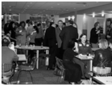
Arriba: El área principal estuvo llena de actividad durante el primer evento Noches de Pachanga.