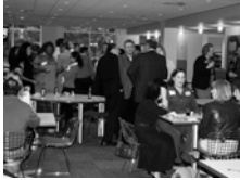
Above: The main floor lobby was swarming with networking activity during ALIANZA's Pachanga Nights event at Wells Fargo.

ALIANZA held the first event in its Pachanga Nights series for 2009-2010 at Wells Fargo Financial in downtown Des Moines on October 1. A fantastic spread was catered by El Chisme and Wells Fargo's H.O.L.A. Team Member Resource Group showcased their activities. Attendees enjoyed the sounds of reggaeton, salsa, cumbia and other Latin music rhythms.