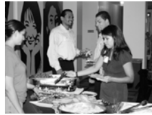
Arriba: El público disfruta de la exquisita comida preparada por El Chisme.