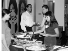
Above: Attendees enjoy the wonderful spread catered by El Chisme.

The event attracted approximately 50 individuals both Latino business owners and professionals alike. The main purpose of the event was to connect ALIANZA's members to the business community at large in a relaxed social setting for some inspired networking.